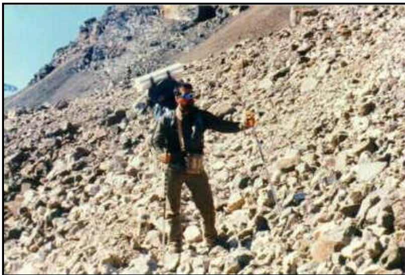
1990. Camino a Invernada del Viejo, Mendoza, tras las huellas de una "ciudad perdida" que nunca existió.